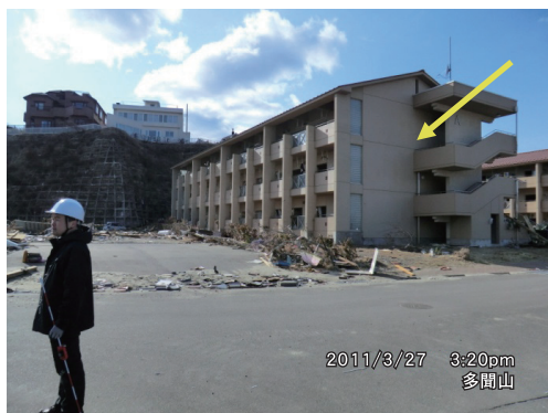
写真4 菖蒲田浜海岸付近（アパート）

避難中の住民の方（60代御夫婦）によれば、「津波は東側と南から来たようだ。地震後、勤務から避難所に戻ると、1Fは浸水した。大人が首まで浸かるほどであった。崖上の食堂が潰れた。」とのことであり、浸水した避難所と崖上の車を確認した。また、菖蒲田浜海岸南端にある被災マンション3Fに居住の方（女性30代）によれば、マンションの3Fの部屋にも少し浸水した。2Fは水没した。」とのことであり、3F廊下の海藻および泥あとを確認し、痕跡とした。