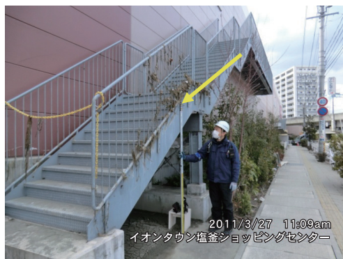
写真2 塩釜港奥（本塩釜駅前イオン）

台港中には現時点で324個のコンテナが沈んでいるのを確認しており、89個を引き上げた。空コンテナは4段積み、積載コンテナは2段積みであるが、2段以上のコンテナは流出した。事務所は1Fが浸水し、職員は屋上へ避難。周辺はソニー（株）の駐車場があり、現在、片づけた車等が置かれている。石巻港はケーソン背後のエプロンが1.5m～2m陥没し、一部を応急復旧中である。」とのことであった。