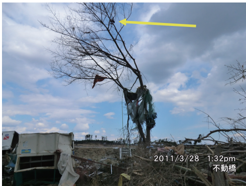
写真6 野蒜海岸（桜の木に残された衣類等）

仙石線野蒜駅は、駅舎・電車が浸水し、駅前の運河上には神社の屋根など漂流物が無数に残る。駅舎の浸水深（地盤上3.5m）を泥跡で確認した。