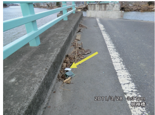
写真7 橋の先端部に残る木切れ・漂着物痕跡

浸水しており、住宅街はほぼ1Fの窓上方（地盤より約2m）まで浸かったことが確認できた。浸水域は地図上で測ると海から約3kmである。