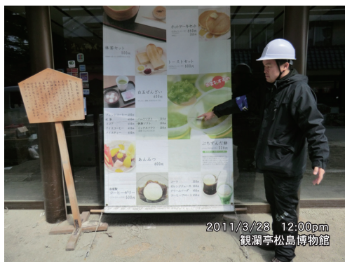
写真5 松島海岸（瑞巖寺前の泥あと）

松島観光協会の職員の方（50代男性）によれば、「津波は地震後30分で南から来たようだ。中央棧橋の先端で渦を巻き、観光船は全体が水をかぶった。浮棧橋（ボンツーン）については、4本中、手前の1本は残り、あとは吉田川等に漂流した。」とのことであった。（吉田川第一橋の100m上流で約50mの棧橋が河中に座礁していることを確認）。また、松島海岸に面した参道を持つ瑞巖寺前の土産物屋主人（40代女性）によれば、「1Fは浸水（痕跡確認、写真5）。4F建てで全員4Fへ逃げた。瑞巖寺の入り口はまっすぐ海から見通せる。奥の瑞巖寺本堂近くまで津波が遡上した。」とのことであり、本堂前の電話ボックスの泥跡を遡上痕跡とした。