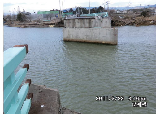
写真8 定川大橋中央桁の破壊（石巻市方向）