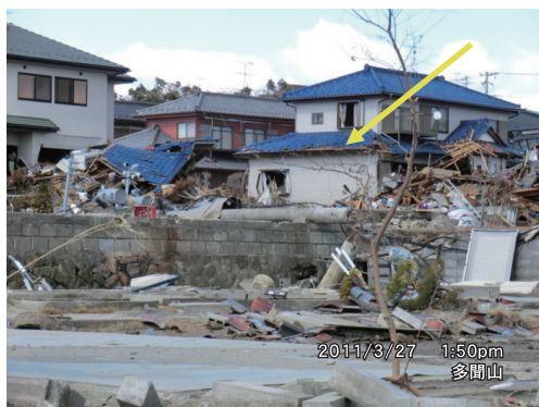
写真3 菖蒲田浜漁港