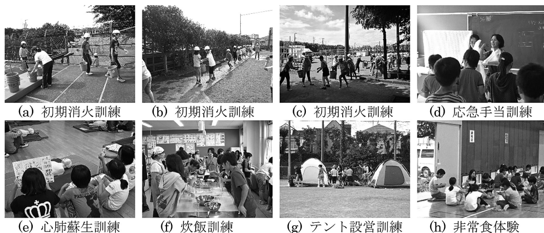
写真1 北網防災宿泊訓練2013

や保護者ボランティアの協力による炊飯袋による米炊飯体験の様子を、写真1 (g) はボーイスカウトの協力によるテント設営訓練の様子をそれぞれ示している。表5の実施体制における共催、後援機関が単に形式的なものではなく、各々が実質的な役割を担っていることが確認できる。写真1 (h) は、写真1 (f) で取り組まれた炊飯訓練で作られたものを非常食体験として実際に夕食としている様子である。同時に夕食の取り方は、児童が所属する町内会ごとのグループ単位とし、町内会の帰属意識の醸成も図っている。宿泊体験の主なねらいは、表8における「地域防災拠点の理解」の部分であり、具体的には学校の体育館が避難者のための生活の場となることの理解や避難生活における共助の理解である。