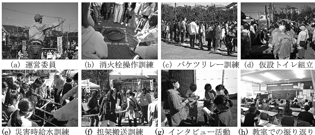
写真2 2018(平成30)年度北綱島小学校地域防災拠点訓練