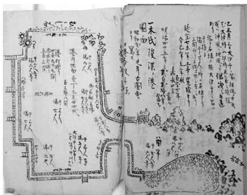
図1 1927年に写された室津港絵地図(室戸港沿革史(資料27-1)の中の図)

この図は橋本・他(2024)の図5と同じものである。橋本・他は、「一木氏浚渫ノ港図面」とあることから、この図の中の深さを延宝7年(1679年)の港の大開鑿工事直後のものとした。しかし、添え書きによれば、これが1845年に計測された深さであることが明らかである。